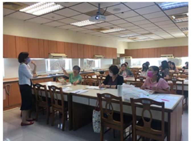
110/11/02 OSCE 教案藍圖討論