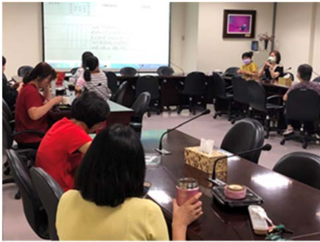
110/10/13 針對已發展完成教案外審結果進行討論 -呼吸道清除功能失效之護理教案