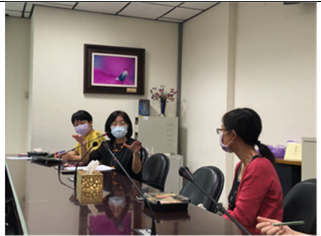
110/10/13 針對已發展完成教案外審結果進行討論 -糖尿病足部護理教案