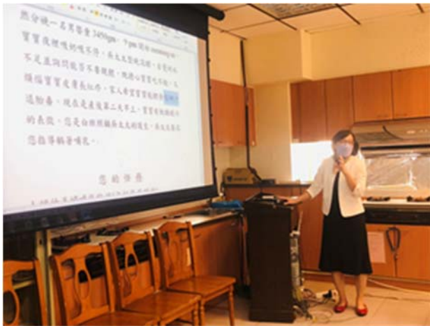
110/11/02 針對已發展完成教案外審結果進行討論 -產後乳房評估教案