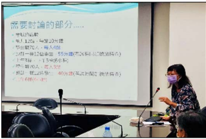
110/9/23 介紹本學期社群的活動安排