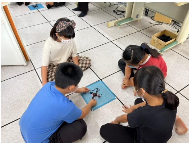
六龜國小學生合作撰寫程式控制無人機