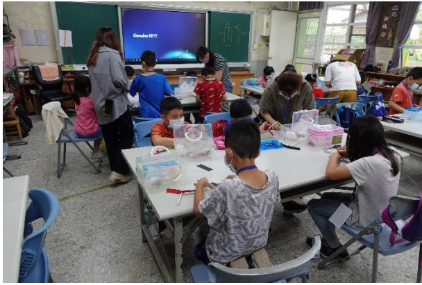
木柵國小學生手做竹蜻蜓