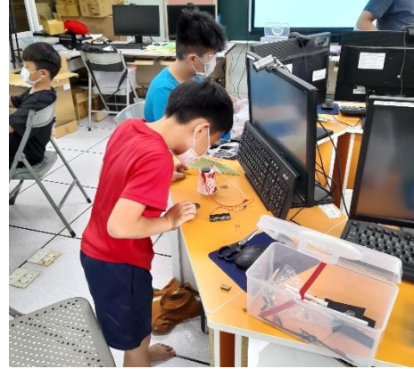
六龜國小學生手做電磁馬達