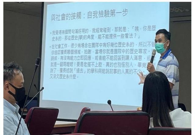
10/5 社群：講者內容說明