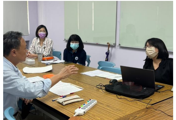
10/19 社群：成員交流討論時間

想加入此社群，請聯絡召集人(或協助人員) e-mail: chienchia@gmail.com