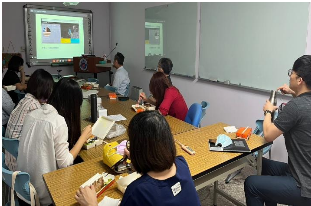
10/19 社群：講者內容說明